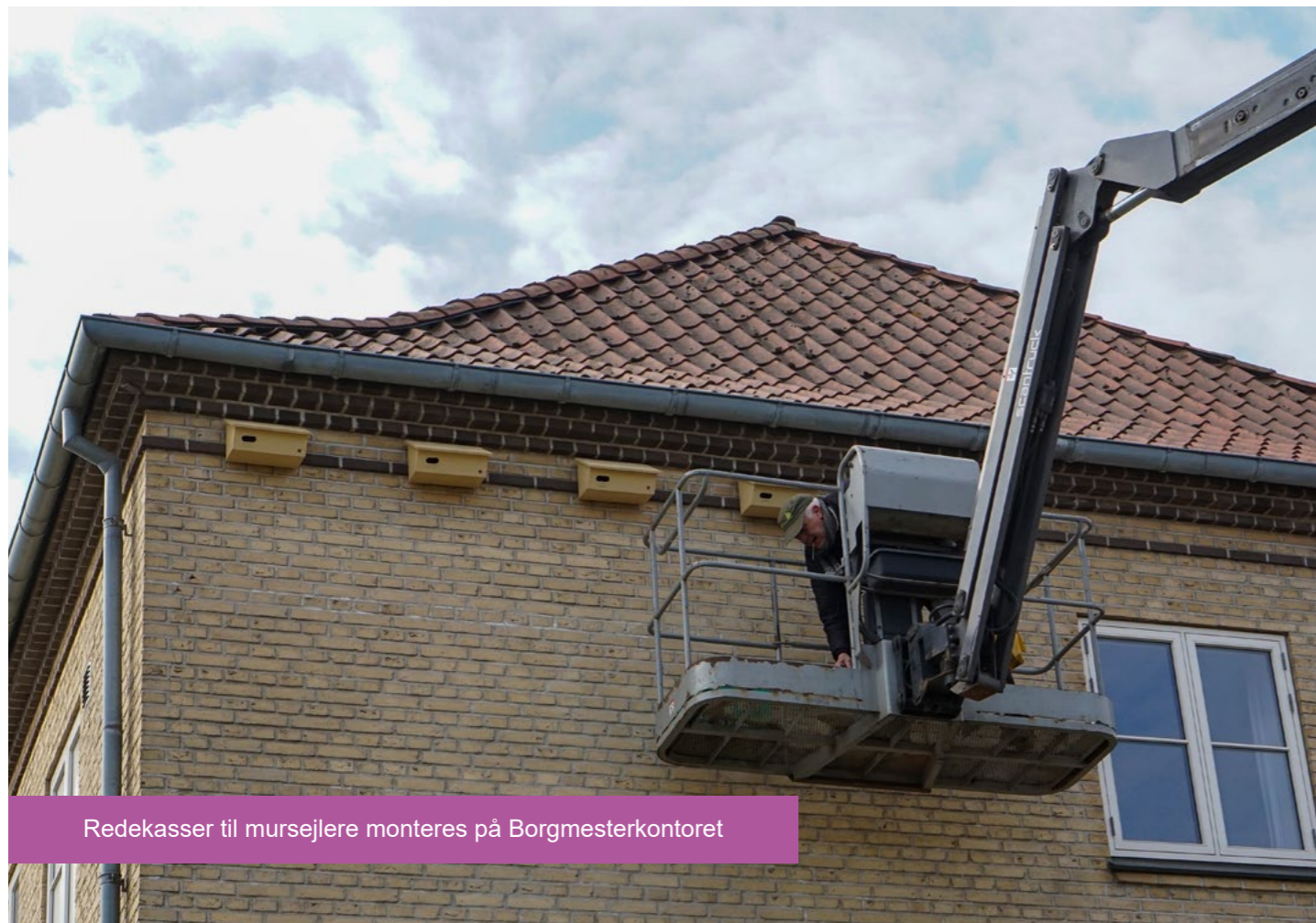
Redekasser til mursejlere monteres på Borgmesterkontoret