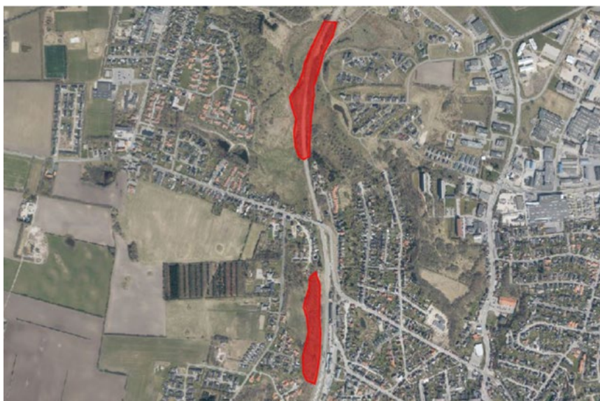
Placering af to kolonier af råger på BaneDanmarks arealer langs jernbanen i Hobro.

Ud over de kommunale arealer er der en række rågekolonier i kommunen, som befinder sig på andre områder. I Hobro drejer det sig særligt om råger i træerne omkring banegården samt et stigende antal råger i træer langs jernbanen vest for Hostrupkrogen. Begge kolonier er beliggende på arealer ejet af BaneDanmark, som er opmærksom på problemet og løbende regulerer ungerne.