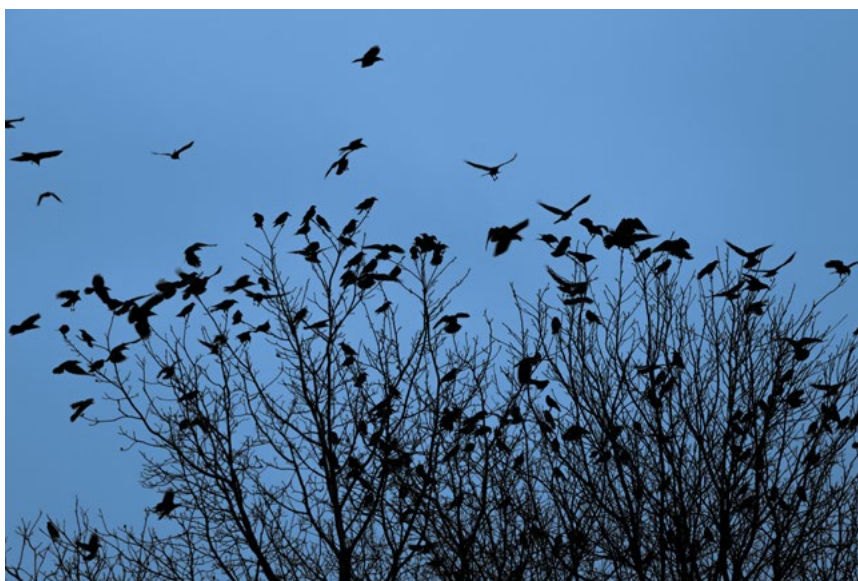
Rågerne yngler i store kolonier i flere byer i Mariagerfjord Kommune

Nærværende plan er udarbejdet på baggrund af kommunens egne erfaringer med regulering af råger siden 2007 og efter faglig sparring med Naturstyrelsens Vildtkonsulent, som har mange års erfaring med arbejdet. Planen bygger således på den bedst tilgængelige viden og erfaring om de mest effektive metoder til at komme udfordringerne med rågerne til livs.