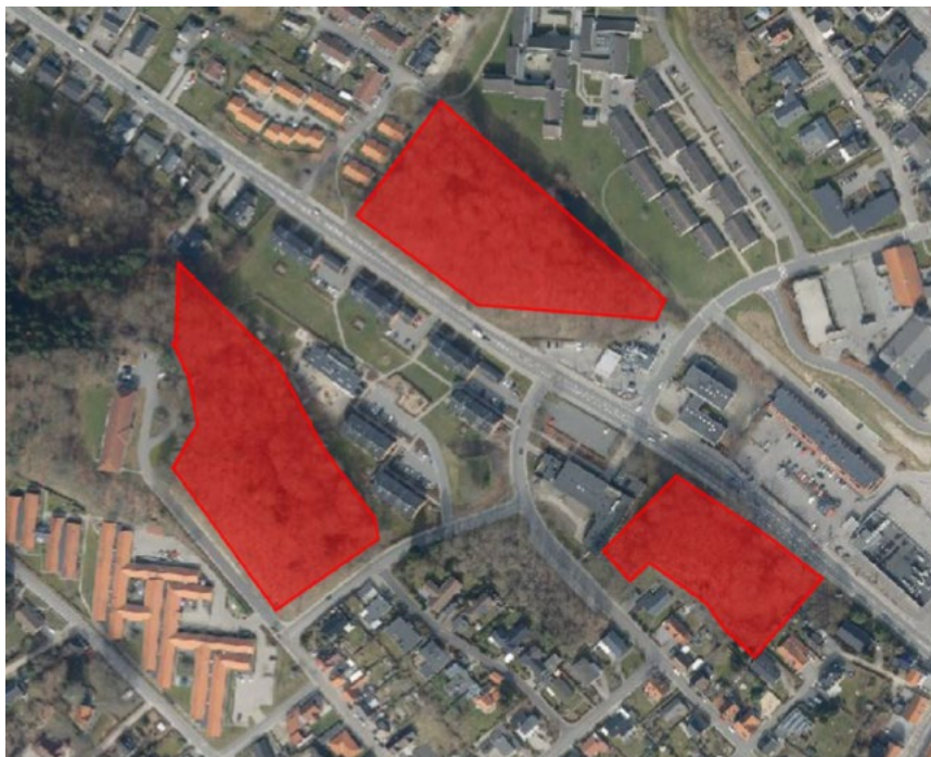
Placering af hovedkoloniene af råger på kommunale arealer omkring rådhuset i Hadsund

Der har i mange år været en større koloni på et par hundrede reder i midtbyen i Hadsund. Kolonien er primært i træerne syd for rådhuset, træerne ved Bernadotttegården og i den sydlige del af Linddalene.