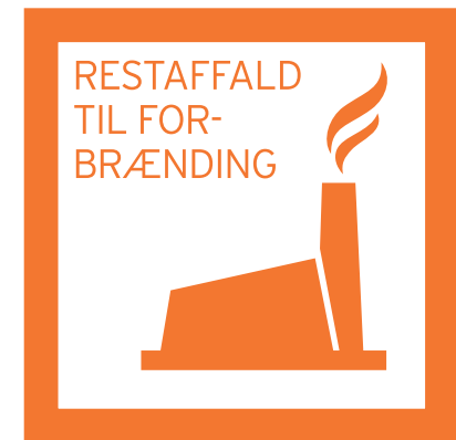
RESTAFFALD TIL FORBRÆNDING, fx: