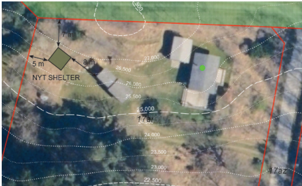
Figur 1: Kort over Kukmarksvej 1, visende bygningernes placering