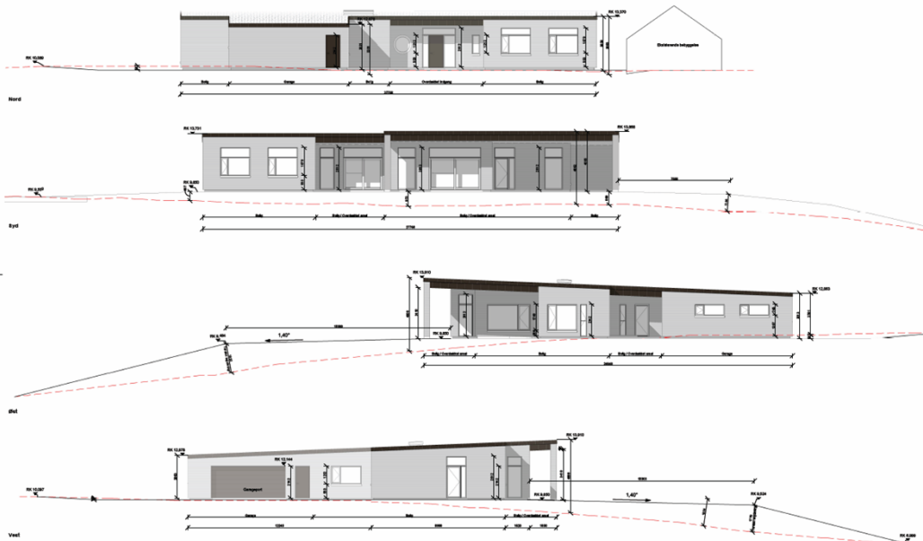
Facadetegninger af det nye enfamiliehus på Rostrupvej 41, 9500 Hobro

Enfamiliehuset får et samlet boligareal på ca. 254 m 2 , med ca. 79 m 2 overdækninger og en integreret garage på 68 m 2 . Det opføres med ensidig taghældning med en maksimalhøjde på ca. med en højde på ca. 5 meter over eksisterende terræn mod syd. Facaderne udføres med mursten og taget udføres med tagpap.