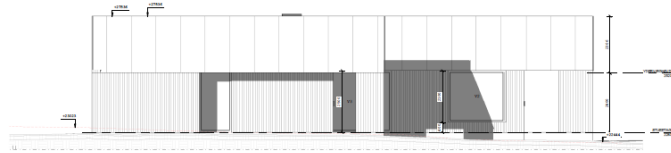
FACADE MOD NORD 1 : 50

Enfamiliehuset får et samlet areal på ca. 192 m 2 og opføres med saddeltag med en maksimalhøjde på ca. med en højde på ca. 4,9 meter over eksisterende terræn. Facaderne udføres med træbeklædning og taget udføres med stålplader. I tilknytning til huset opføres der 46 m 2 overdækninger, samt en carport på 20 m 2 med et indbygget udhus på 10 m 2 .