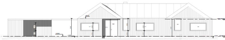
FACADE MOD ØST