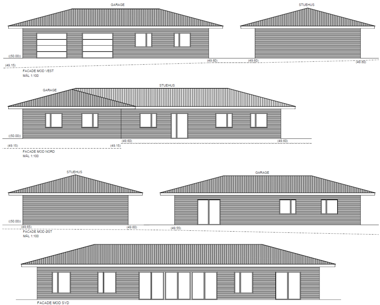
Facadetegninger af det fremtidige stuehus og garage