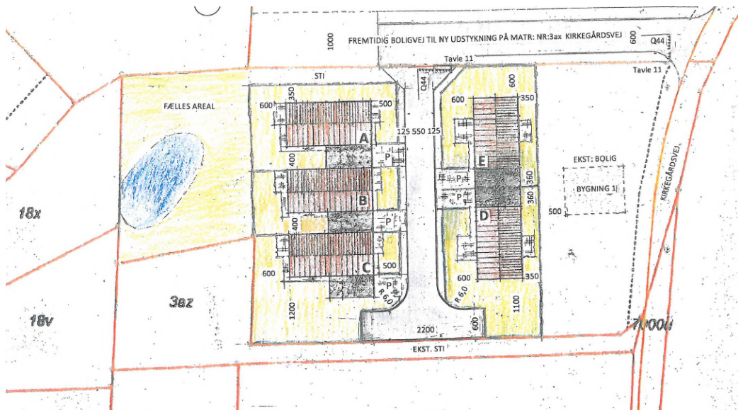
Fig. 1 Situationsplan med placering af de tre rækkehuse