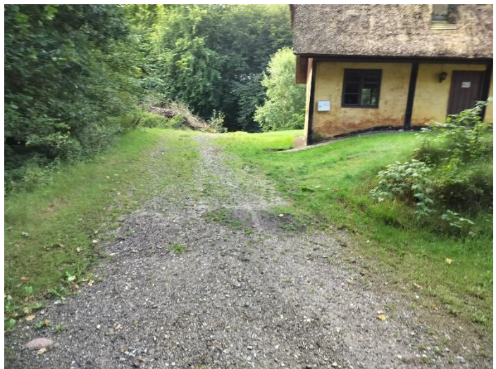
Figur 2. Billederne viser skovvejen, der fører forbi ejendommen Amerikavej 50. Billederne er fra ansøgningen.