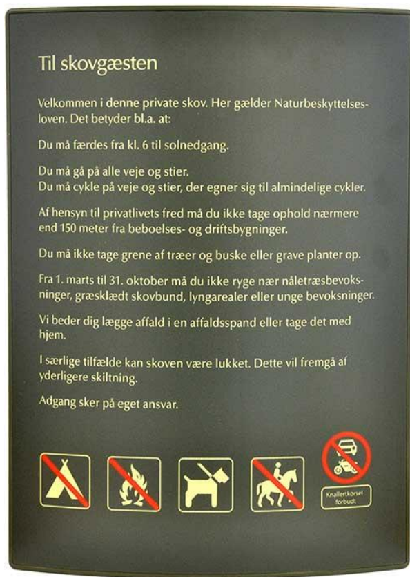
Figur 3. Færdselstavle for privat skov som i samspil med skovens ejer kan placeres i begge ender af vejens forløb for at præcisere adgangsreglerne for private skove.

Mariagerfjord Kommune giver hermed afslag på din ansøgning om at afspærre skovvejen, der fører forbi ejendommen Amerikavej 50, Skovgård, 9500 Hobro, for offentlighedens færdsel til fods og på cykel enten midlertidigt eller permanent. Det vil dog være lovligt at præcisere færdselsreglerne for privat skov ved at opsætte en færdselstavle for privat skov i begge ender af vejens forløb i samspil med skovens ejer (se figur 3). En sådan færdselstavle forbyder blandt andet motoriseret færdsel og løse hunde og præciserer, at man ikke må tage ophold i nærheden af beboelse.