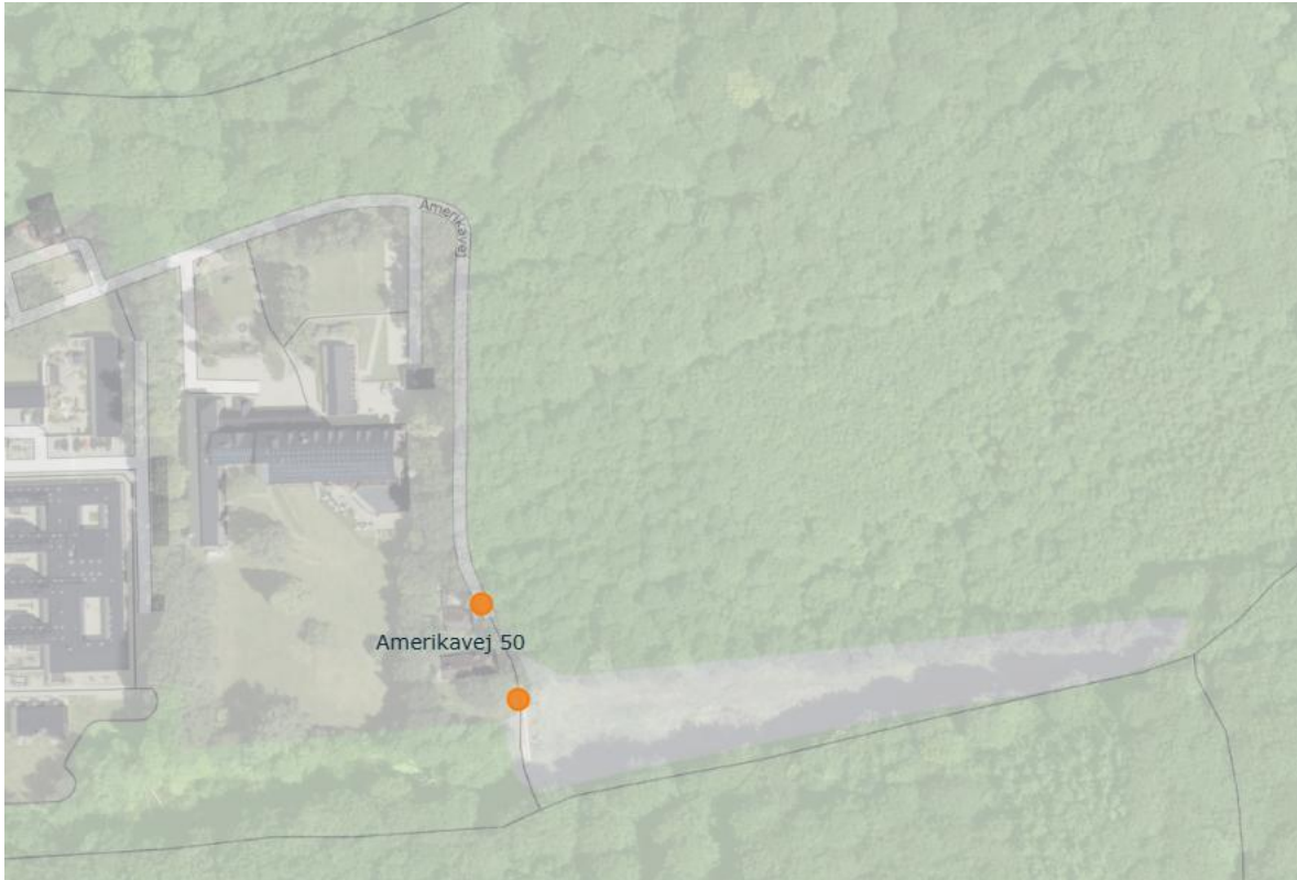
Figur 1. Kortet viser placeringen af boligen ved den gennemgående skovvej. Skovvejen ønskes afspærret midlertidigt eller permanent mellem de to orange markeringer.