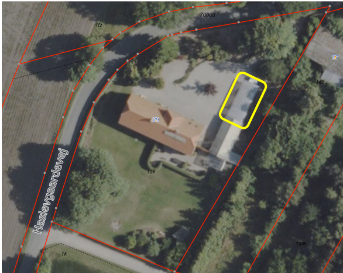
Situationsplan: Carporten er markeret med gult.