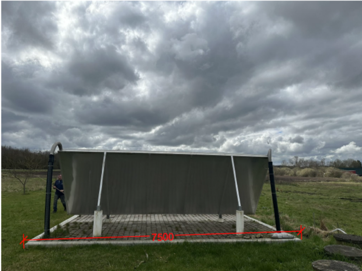
Figur 3: Foto fra nord som viser anlæggets bredde