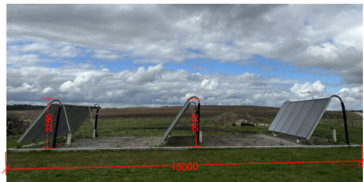
Figur 2: Foto fra øst, som viser anlæggets længde og højde