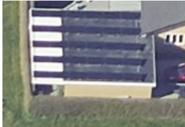
Figur 2: Facade mod syd

Overdækningen er opført med fladt tag, og har en højde på 2,32 m. Bygningens tag beklædes med tagpap. Overdækningen er monteret på eksisterende garage. På taget af overdækningen og garagen er der opsat solceller.