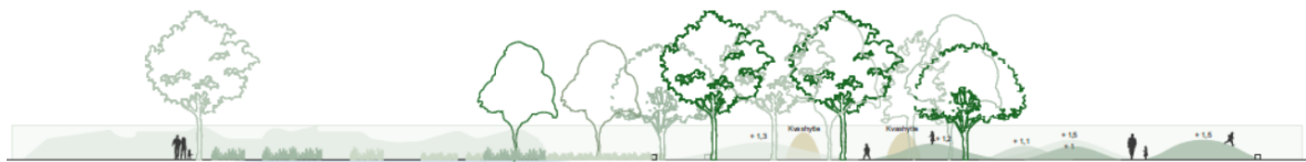
Figur 2: Opstalt af projektområde