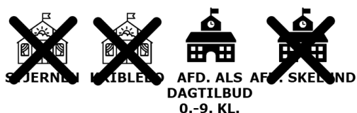
Figur 4 Illustration af scenarieversionen

Udgangspunktet bliver dermed afdeling Als, der rummer alle dagtilbudspladser og alle elever fra 0.-9. klasse. Det giver et større fagligt fællesskab, men kræver samtidig anlægsinvesteringer for at rumme både dagtilbud og skole. Version 2 muliggør en lukning af både Stjernen, Kriblebo og afdeling Skelund.