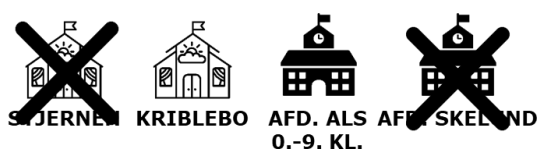
Figur 3 Illustration af scenarieversionen

Ved en samling i Als lettes samarbejdet mellem dagtilbud og skole, der ligger tæt på hinanden fysisk, uden dog at være på samme matrikel.