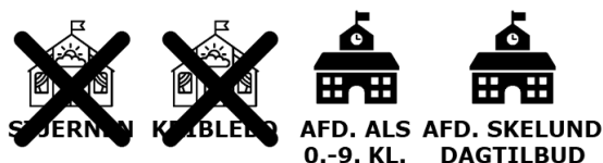
Figur 1 Illustration af scenarieversionen

Argumentet for at samle dagtilbud i Skelund er, at der ved denne sammenlægning opnås en større børnehave i Skelund med over 60 børn. Det betyder, at der kan dannes flere børnegrupper, eksempelvis blandt børn, som er skoleparate, eller børn der har særlige behov.