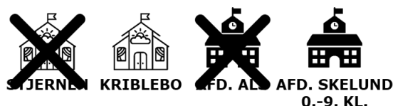
Figur 7 Illustration af scenarieversionen

Dagtilbud samles i Kriblebo, der rummer børn fra både Stjernen og Kriblebo, hvilket kan gennemføres uden udbygning.