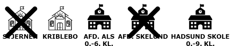
Figur 5 Illustration af scenarieversionen

Samling af aktiviteterne i Als betyder, at en del forældre og børn i Skelund, Veddum og Buddum alt andet lige får længere til dagtilbud og indskoling. Dette er belyst i tabeller med afstande mellem hjemmematrikler og institutioner/afdelinger i scenarie 1.