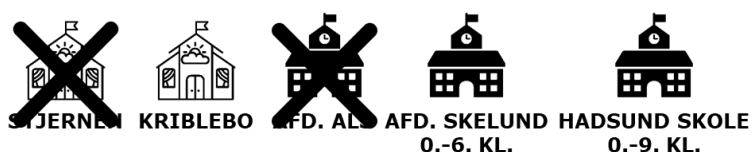
Figur 8 Illustration af scenarieversonen

Nogle forældre får kortere transporttid, andre længere, jf. analysen under scenarie 1.