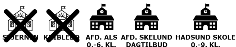
Figur 2 Illustration af scenarieversionen

Det betyder, at der bliver en øget transporttid for hovedparten af udskolingseleverne. Effekten for transporttiden er søgt anskueliggjort i den efterfølgende tabel: