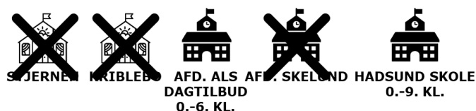
Figur 6 Illustration af scenarieversonen

Der er etableret et sammenhængende børneunivers på én matrikel, nemlig dagtilbud og 0.-6. klasse placeret på afdeling Als. Der er således nye og forbedrede rammer for professionelle læringsfællesskaber gennem ét stort fællesskab, etableret på én matrikel. Der er dermed mulighed for at specialisere sig som basisskole med målgruppen børn/elever fra deres 3. til 12. år.