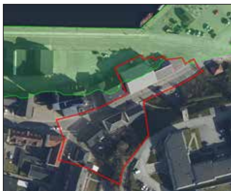
Illustration 2: Det grønne område viser hvor der er under kote 2,00 m DVR90. Med rød streg vises lokalplanområdet.

Planområdet ligger hvor det er lavest ved Sdr. Kajgade 20 i kote 2 meter DVR90, hvor der frem til år 2100 kan forekomme problemer ved fremtidige højvandshændelser, eksempelvis i forbindelse med stormflod, svarende til et