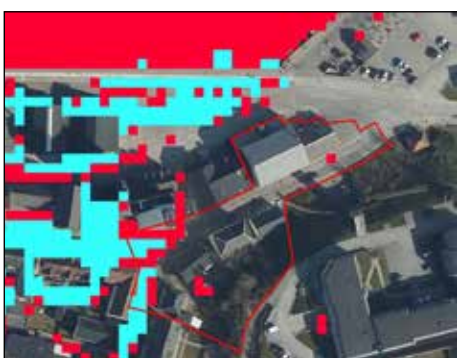
Illustration 3: Skybrudskort for Hobro, hvor farverne viser vand på terræn ved henholdsvis en 10 års hændelse (turkis) og en 100 års hændelse (rød). Med rød streg vises lokalplanområdet.