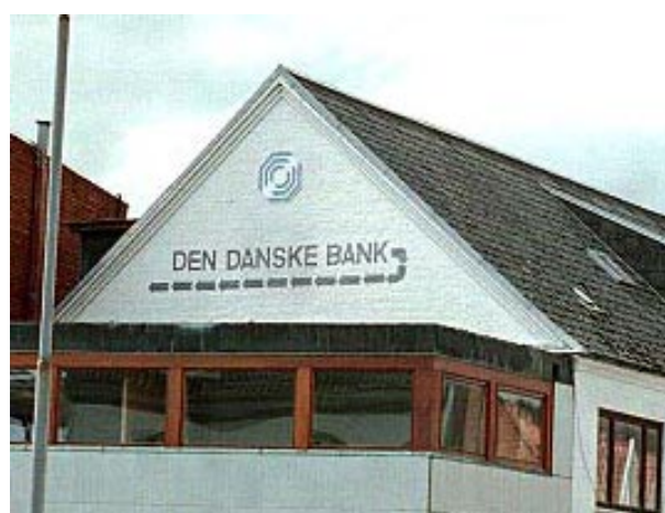
Henvisningsskilte kan også males direkte på muren uden det virker dominerende.