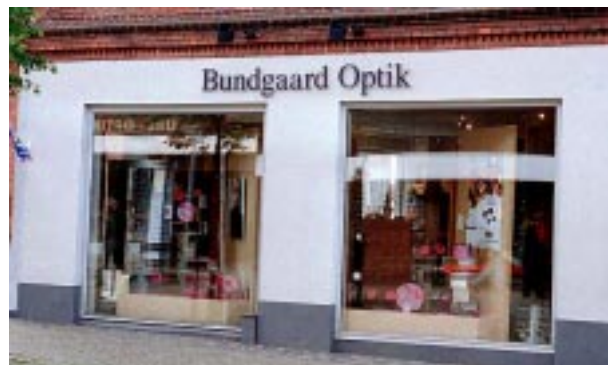
En enkel og velafstemt butiksfacade, der skiller sig naturligt ud fra resten af bygningen.