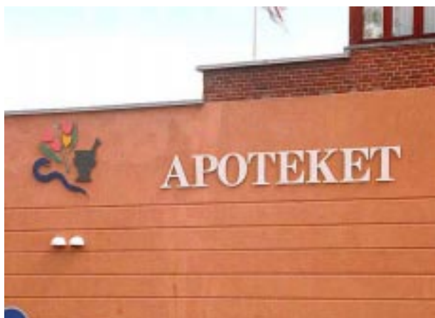
Fremtrædende løse bogstaver giver en elegant effekt og er let læselig.

Pladeskilte bør opsættes, hvor facaden naturligt giver plads hertil. Skiltene må ikke dække over nogen del af vinduet eller rage op over gesimsen.