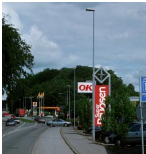
Standerskilte må kun anvendes ved servicestationer.

* Korona er den lysende krans man kan se omkring solen i forbindelse med solformørkelse.