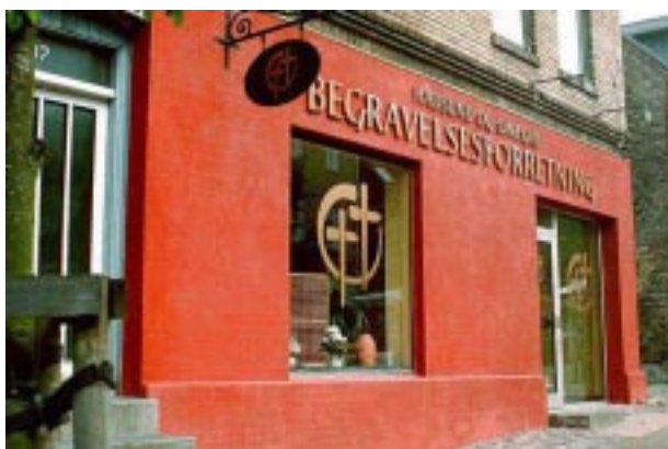
En iøjnefaldende, men smuk facadeløsning.