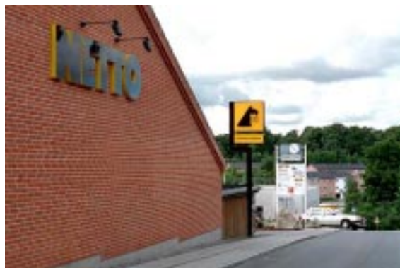
De store dagligvarebutikkers skiltning er også med til at tegne bybilledet.