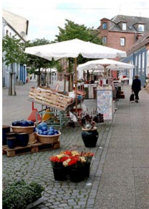
En god og smuk udnyttelse af udstillingszonen, hvor der er luft mellem de udstillede varer og ingen dominerende skilte.

Hvor der gives tilladelse til at opsættes hegn eller anden afskærmning omkring fortovsrestauranten skal der vælges en åben, let og neutral løsning. Der kan fx vælges træ- eller metalhegn med