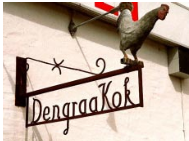
Restauranter er ofte symboliseret ved dyr. Her er der desuden direkte sammenhæng med restaurantens navn.