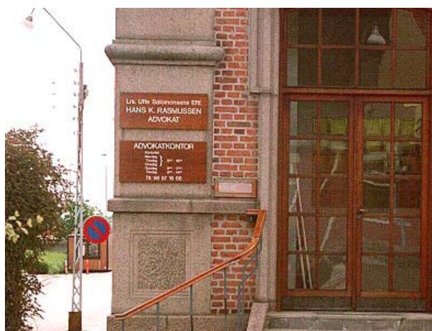
Henvisningsskilte skal være diskrete og kan med fordel udformes i materialer, der matcher bygningen de sidder på.