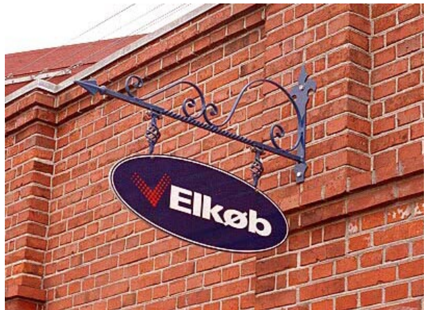
Her er udhængsskiltet tilpasset bygningens alder og stil - selvom der bliver solgt hårde hvidevarer.