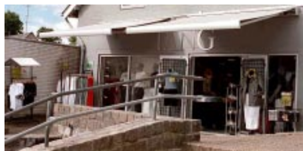
Markiser af stof er flotte og virker lige så godt som faste baldakiner. Og så har de den fordel, at de kan »gemmes« væk efter lukketid.