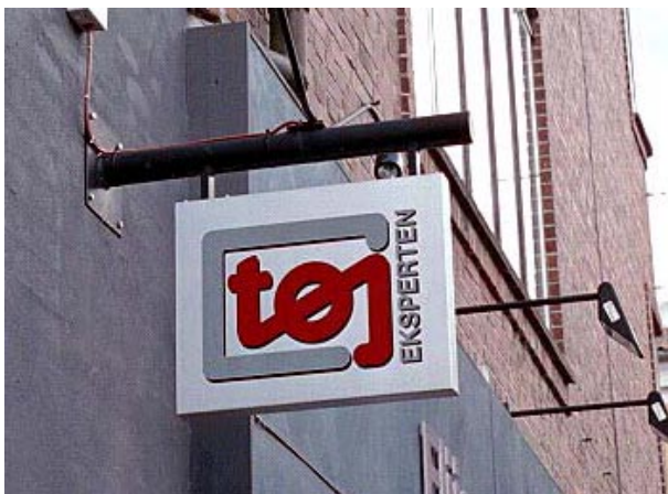
Et moderne udformet udhængsskilt med et let genkendeligt logo.