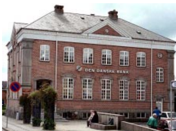
Skiltningen bør ikke dominere bygningen, men tilpasses bygningens karakter.

Butiksvinduerne er et andet oplagt sted at placere facadeskiltet, da vinduet sidder i den rigtige synshøjde. Samtidig er skilte, der er malet, påtrykt eller påklæbet ruden, en diskret form for skiltning. Vinduesskiltene synlighed kan dog være et problem, men det kan afhjælpes ved at vælge en god kontrastfarve i forhold til baggrunden inde i forretningen.