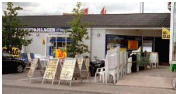
For mange skilte og for mange udstillede varer forvirrer ikke bare kunderne men også gadebilledet.

let struktur, lyse læ-sejl eller en form for levende hegn. Sidstnævnte kunne have karakter af potter eller kummer med fx buksbom.