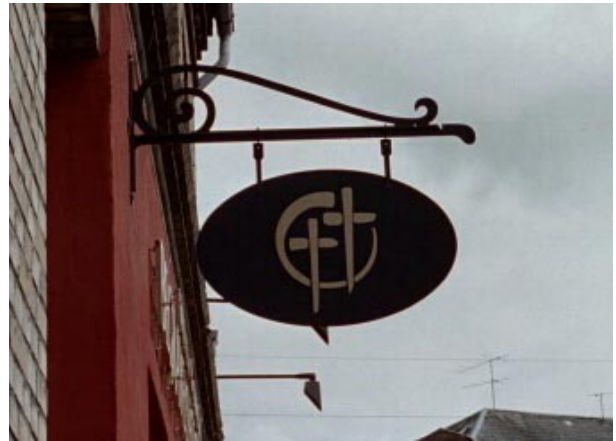
Et enkelt og smukt udformet udhængsskilt.

Udhængsskilte, der ophænges sådan, at de kan bevæge sig frit i vinden, er normalt flottere end fastgjorte skilte.