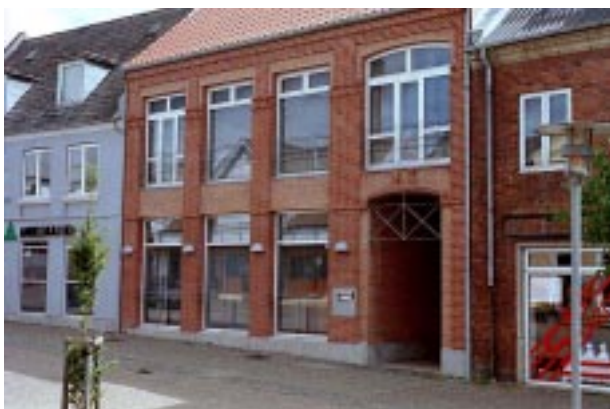
Nye bygninger skal harmonere med nabobygningerne mht. proportioner, opdeling og ydre fremtræden.

Proportioner og detaljer er med til at understrege en bygnings alder og byggestil. Det siger sig selv, at det derfor er vigtigt at bevare – og evt. fremhæve - karakteristika på facaden i forbindelse med en ændring. Det er også vigtigt at vælge materialer med omhu. Som udgangspunkt skal man bevare facadens oprindelige fremtoning, dvs. med blanke eller pudsede mure. Ønskes en anden løsning, bør man kun vælge materialer, der harmonerer med bygningens oprindelige udtryk.