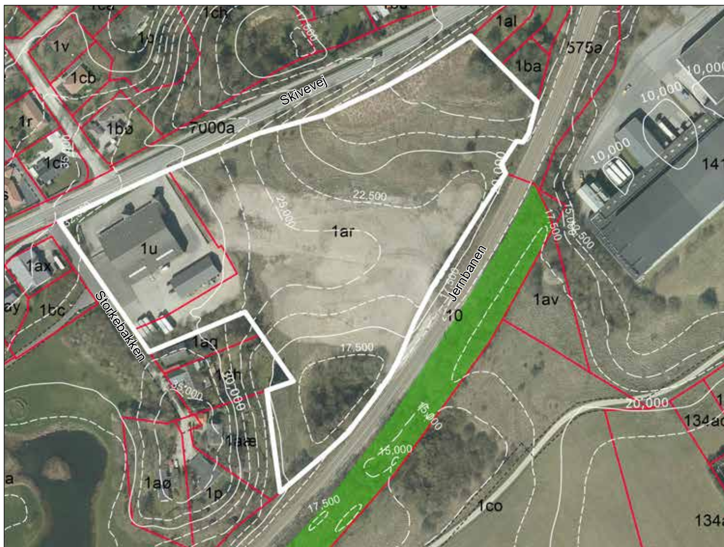
Illustration 1: Planområdet ligger mellem Skivevej og jernbanen i det vestlige Hobro.

Med kommuneplantillægget aflyses rammeområde HOB.B.45 i sin helhed og HOB.B.10 indskrænkes for så vidt angår virksomheden på Storkebakken 1, som fremover skal indgå i erhvervsområdet.