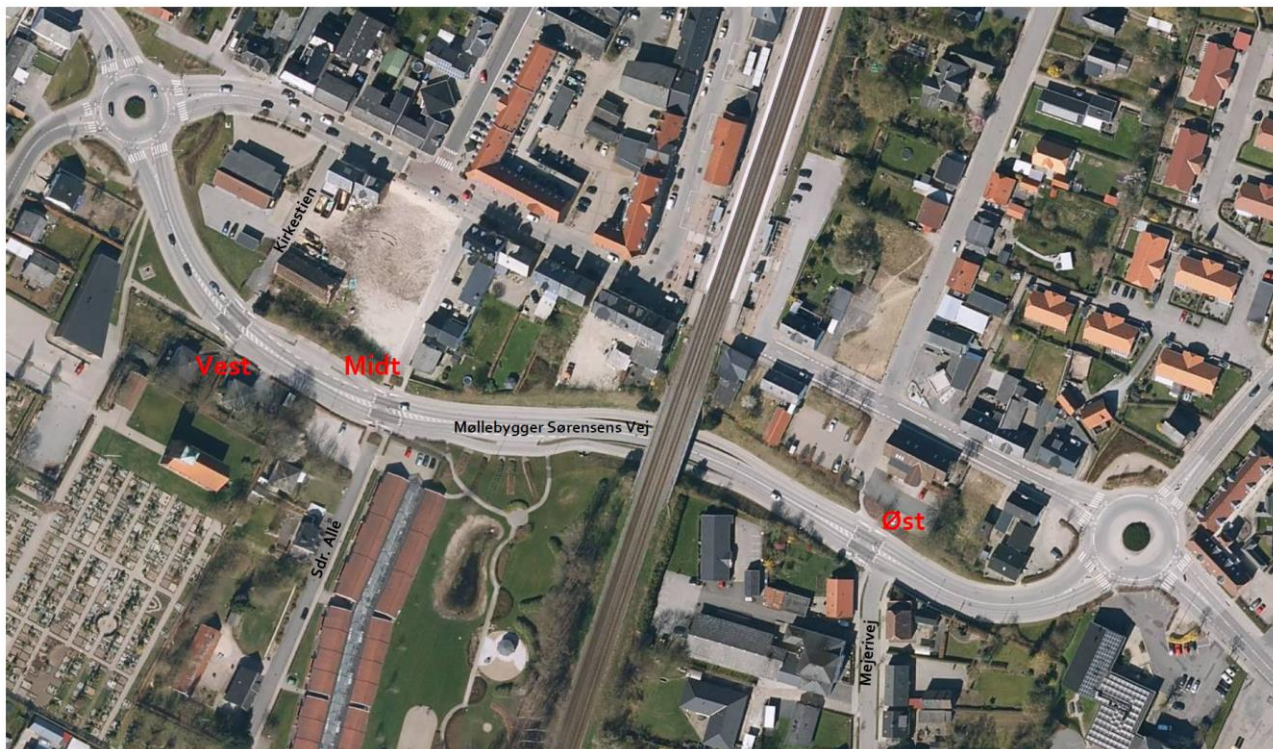
Figur 1: Oversigt over krydsningspunkter på Møllebygger Sørensen Vej.