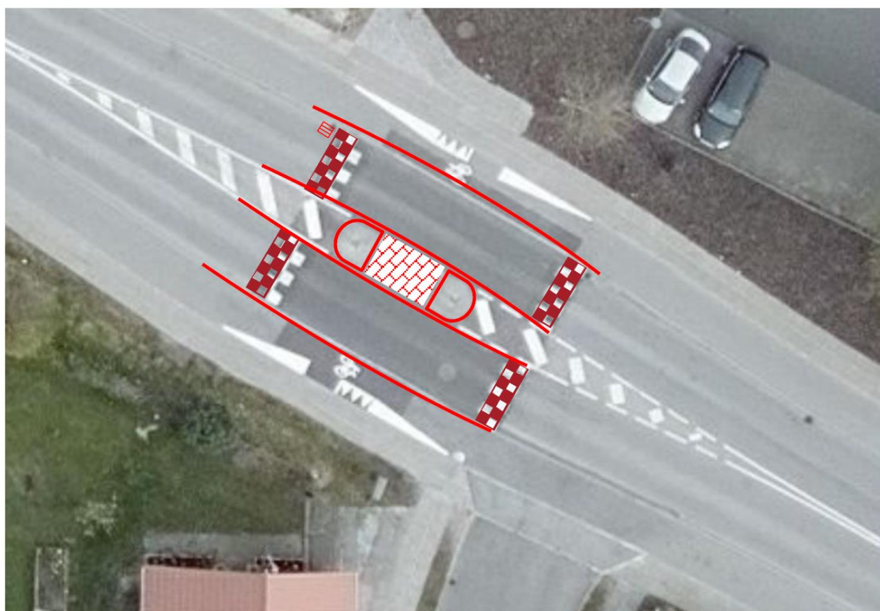
Figur 4: Forslag til justering af det østlige krydsningspunkt.